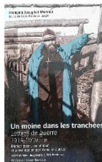
Chronique du quotidien des poilus.